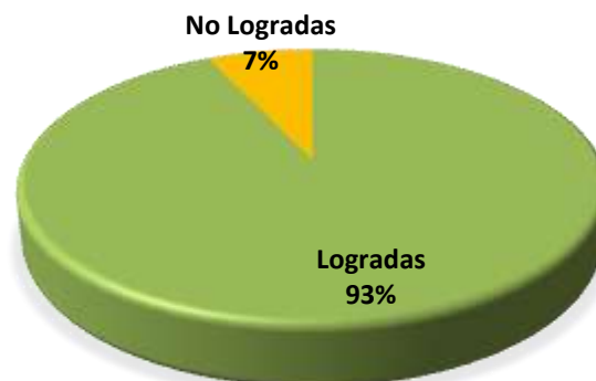
DIRECCION DE NOMINAS Y SEGUIMIENTO AL SISTEMA DE REPARTO

A continuación, los resultados particulares alcanzados por área en la ejecución de tareas y productos bajo su responsabilidad, cumpliendo con el tiempo establecido.